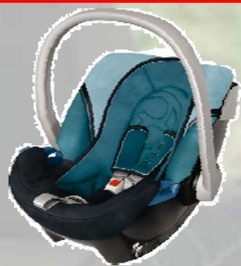
Siège pour bébé

Un dispositif de retenue pour enfants est un des systèmes suivants :