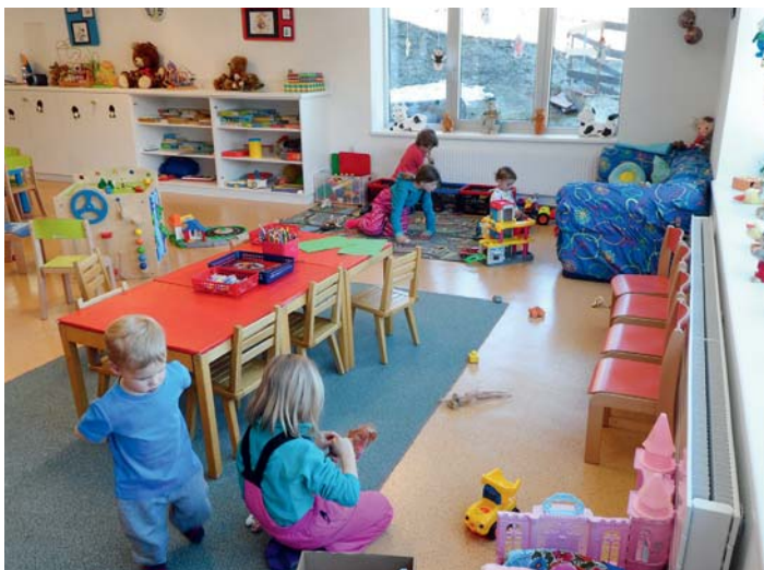
Crèche La Toupie.